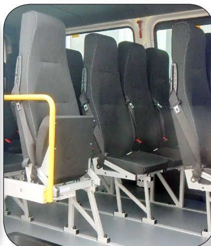
Sitze mit Klappkissen bieten bessere Platzverhältnisse zum Ein- und Aussteigen.