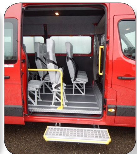
Tritt bei der Schiebetüre, Griff an der B-Säule und die Haltestange geben Sicherheit beim Ein- und Aussteigen.

BAMBI flex ist ein Schulbus-Sitz mit Stahlrahmen und PIUMINO flex - sein "leichterer Bruder" - ist eine Weiterentwicklung aus Leichtmetall, so können knappe Nutzlasten kompensiert werden.