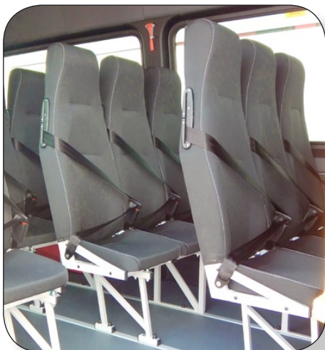
Der seitliche Gurtauslass über 170 mm Höhe garantiert eine richtige Gurtführung bei kleinen und grossen Passagieren.